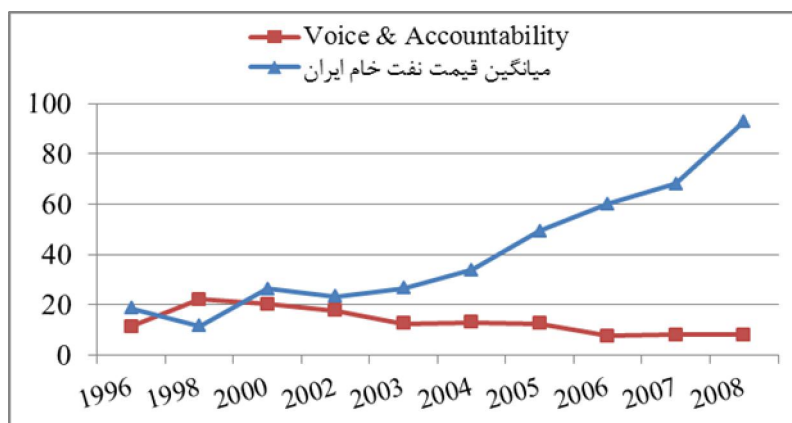
نمودار ۲. ارتباط پاسخگویی دولت و قیمت نفت

همانطور که در نمودار (۲) مشاهده می‌شود با افزایش قیمت‌های نفت خام در ایران میزان پاسخگویی دولت رو به کاهش می‌رود. این مسئله تأکیدی است بر تأثیر منفی و فور منابع درآمدی بر میزان پاسخگویی دولت که در آمارهای بانک جهانی شاخص پاسخگویی دولت برداشتی است از آزادی بیان، آزادی انجمن‌ها، آزادی رسانه‌ها و اینکه چه تعداد از شهروندان یک کشور قادر به مشارکت در انتخابات دولت خود هستند.