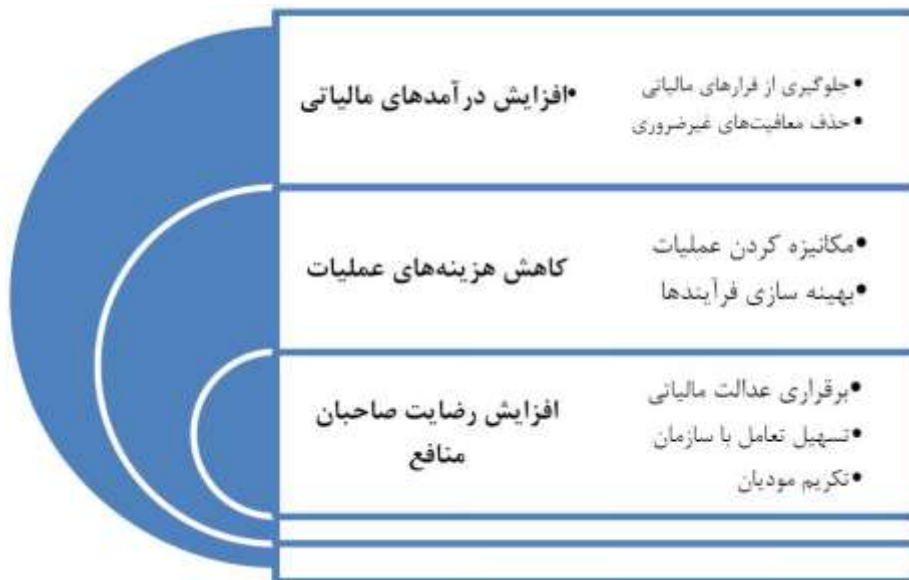
شکل ۱- اهداف اصلی طرح جامع مالیاتی

مالیاتی و ... (شکل ۱)؛ (سازمان امور مالیاتی کشور، نگاهی به طرح جامع مالیاتی)، ۱۳۹۰: ۱۳-۱۰).